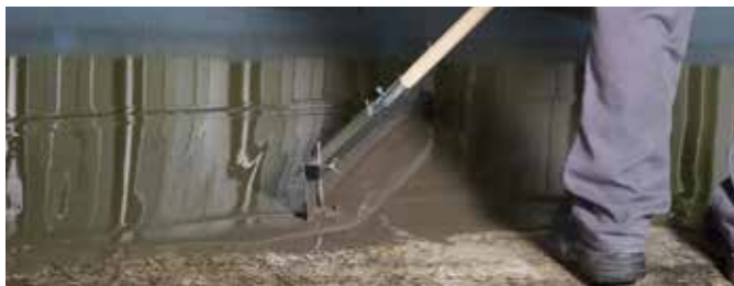
5 Dok obrađujete veće površine koristite KÖSTER grablje za mjerenje za raspodjelu materijala