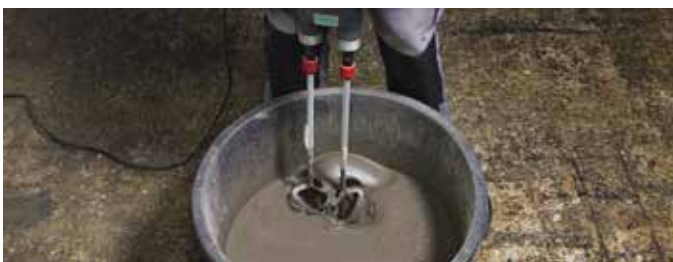
3 Električnom miješalicom s lopaticom intenzivno miješajte tri minute