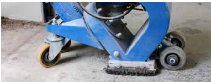
1 Priprema podloge