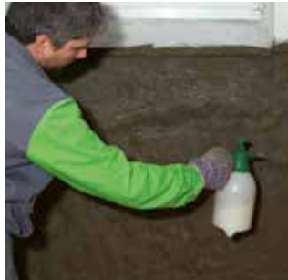
Pošpricajte KÖSTER Polysil-om TG 500

Možete ih koristiti u povijesnim građevinama, izravno kao dekorativnu žbuku ili se dodatno boji paropropusnom bojom. KÖSTER Sanacijske žbuke prikladne su za unutarnje i vanjske prostore i u skladu su s usklađenim europskim standardima (CE).