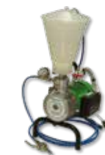
KÖSTER Pumpa za injektiranje 1K

6 Izbušene rupe se zatim popune KÖSTER KB-Fix 5