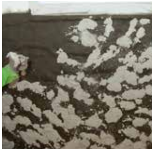
Nanošenje KÖSTER Sanacijskog šprica