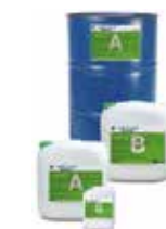
KÖSTER Mautrol 2K

3 Pomiješajte obje komponente dok se ne postigne homogena konzistencija