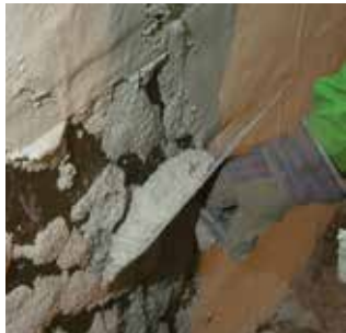
Primjena KÖSTER Sanacijske žbuke