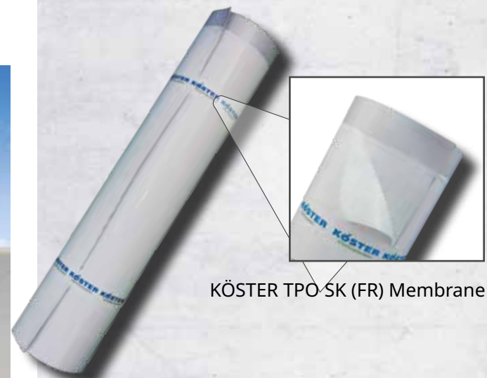
KÖSTER TPO SK (FR) Membrane